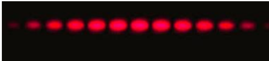
Document 2 : Figure d'interférence obtenue

Un laser rouge de longueur d'onde \lambda = 633 \text{ nm} , éclaire deux petits trous espacés d'un écartement e . On se place au point M sur l'écran.